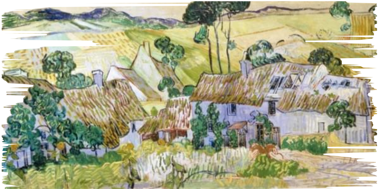
Vincent Van Gogh, La ferme de Jorgus