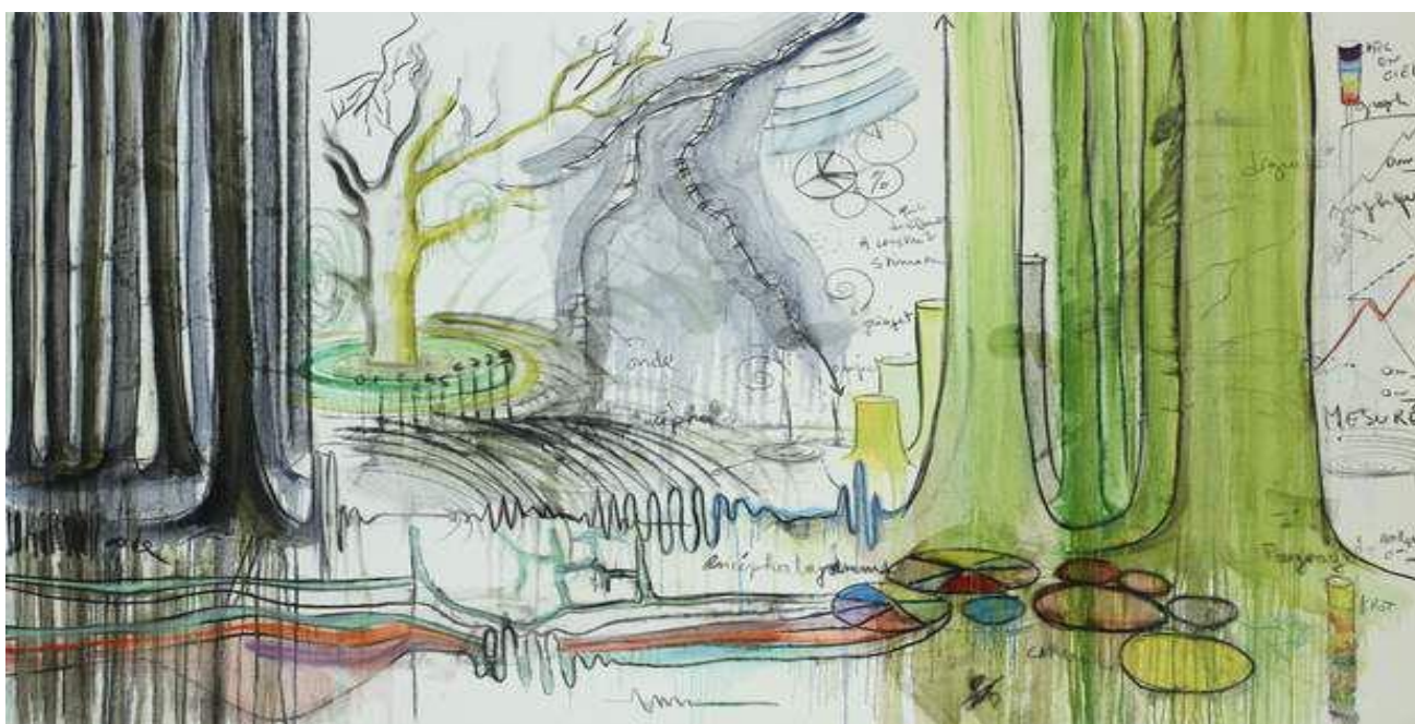
Paysage de mesures, Huile et Fusain, 2019

Artiste-semeur, qui a planté quelques 300 000 graines d'arbres dans sa vallée vendéenne, Fabrice Hyber (France) offre dans ses toiles une observation poétique et personnelle du monde végétal. Interrogeant les principes de croissance en rhizome, d'énergie et de mutation, de mobilité et de métamorphose, l'artiste rejoint, à travers son vocabulaire plastique, les recherches scientifiques les plus actuelles sur l'intelligence des plantes ou la communication des arbres. « Lorsque je dessine un arbre », écrit-il, « j'essaie de me mettre dans sa peau... un vêtement d'écorce. J'imagine qu'il a, par analogie avec nos comportements profondément humains, des fonctions invisibles : comme nous, il se déplace et communique avec les autres ; il peut être fou ou sage, hystérique ou calme, en fonction du contexte et de l'environnement. »