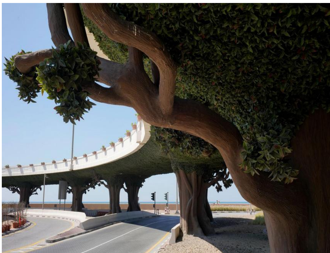
Pont et arbres artificiels à Dubaï, 2018

L'exposition Humanité végétale, le jardin déployé est le récit en images d'un périple de dix ans réalisé par Mario Del Curto à travers le monde. Le photographe explore la relation de l'homme et du végétal et nous invite à réfléchir au développement d'une « humanité hors sol ». Parmi les lieux visités par l'artiste, il y a l'immense forêt de pommiers originels du Kazakhstan menacée de disparition, les jardins urbains de plusieurs mégalopoles, l'excentrique Parc des monstres de Bomarzo et des jardins singuliers ou modestes du monde entier. Sauvage ou façonné, le jardin évoque toujours une culture, des personnalités ou des savoirs transmis. En images fortes et symboliques, Mario Del Curto l'expose dans toutes ses dimensions – alimentaire, scientifique, ornementale, artistique et politique.