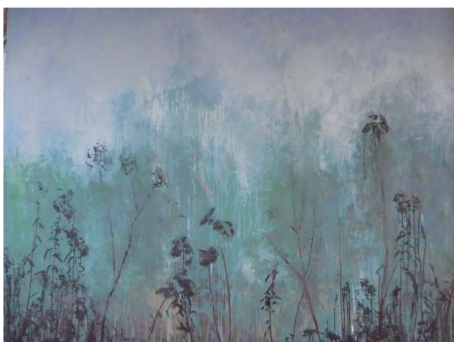
Au bord du chemin I

Peut-on encore peindre un paysage aujourd'hui? Poser cette question c'est déjà y répondre. Il suffit de regarder autour de soi pour constater qu'avec le retour à la peinture l'homme et son environnement sont redevenus des sujets majeurs. Et ce ne sont pas David Hockney, Anselm Kieffer ou Gerhard Richter qui me contrediront. Dans paysage il y a nature. Aujourd'hui la nature n'est plus celle que traverse et dis-sèque le discours du savoir, c'est celle secrète et compacte des légendes modernes; nature parcourue d'énergie confuse elle est le théâtre de combats obscurs loin des milieux aseptisés du monde informatisé.