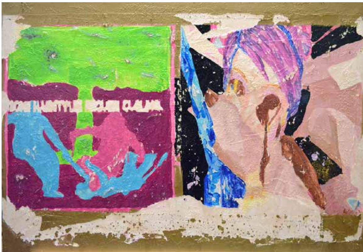
Comme une commune Techniques mixtes sur toile 2019

« La découverte picturale et l'interaction virtuelle sont au cœur des créations présentées.