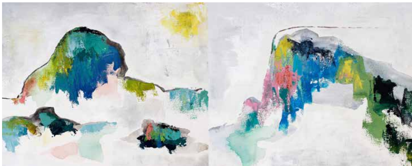
Petits Paysages Acrylique sur toile 2018

La peinture d'Albane Dela s'articule autour de deux univers : la couleur et le mouvement. Pour l'artiste, la peinture vient de l'intérieur. C'est une idée qui prend forme sur la toile et qui part de l'acte de peindre, met le corps en action. Elle accorde une attention particulière aux gestes, à leur genèse, à leur exécution. Le corps peut être vu comme un passeur, un outil au service d'une émotion, d'un besoin. Il est celui qui matérialise et fixe les sensations de l'artiste.