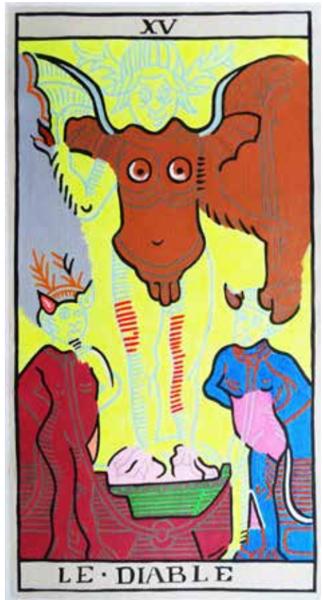
Un Noël pas très catholique (détails) Acrylique sur toile

«Les cartes du Tarot sont des géographies ramifiées, lieux de vagabondages infinis. Pour cette exposition, trois nativités épousent les lignes du BATELEUR, de l'ÉTOILE, du MONDE et du DIABLE. Le Tarot Conver ne serait-il pas une banque de segments à combiner?