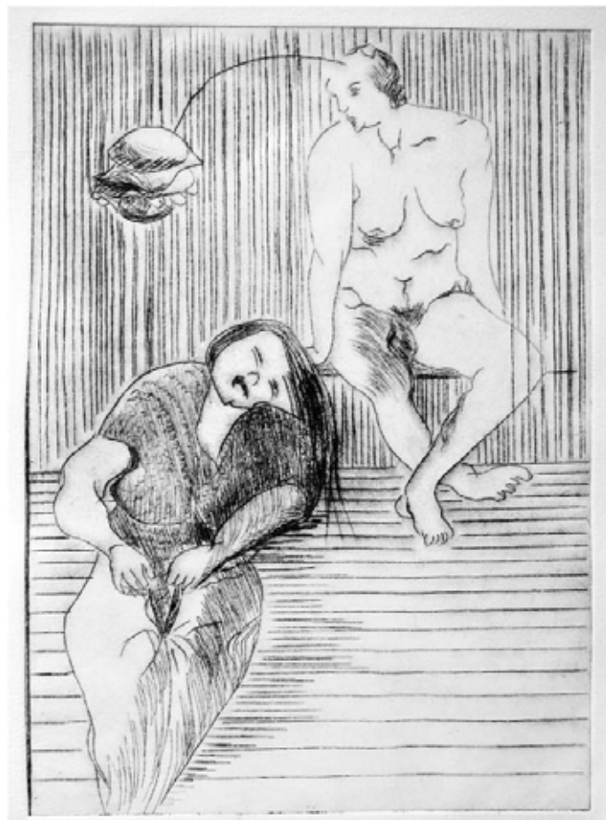
Diktat Pointe sèche tirage papier Etrennes

«Pour l'exposition Joyeuses Transgressions j'ai utilisé quelques unes des techniques habituelles de l'estampe, de la pointe sèche, ainsi que le monotype et l'impression à tirage unique sur drap. J'ai revisité certains textes humoristiques ou poétiques : L'Opel Kadett de Pierre Desproges, La petite robe bleue jetée aux orties de Françoise Sagan (extrait de son livre la petite robe noire ), La jeune fille à la perle de Tracy Chevalier, Voyelles de Rimbaud, le Père Noël dans Coule la Seine de Fred Vargas ...»