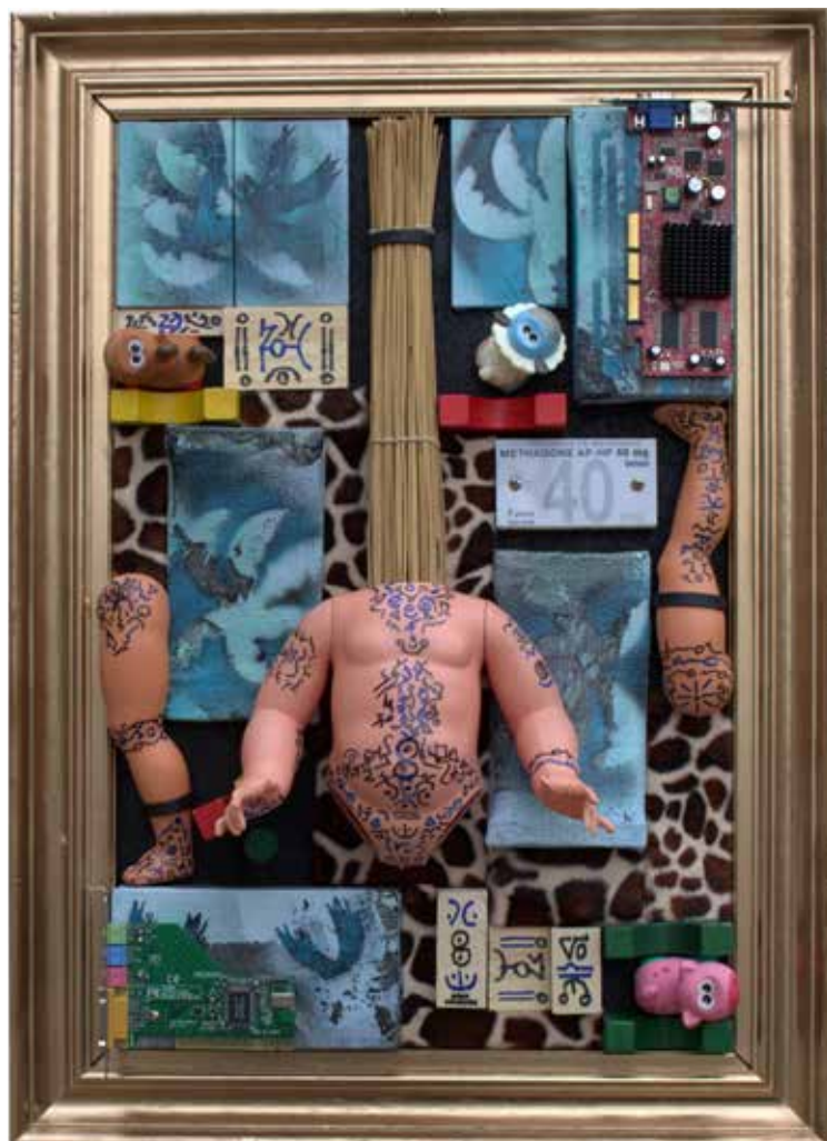
Methadone animals Objets divers, peinture aérosol, cadre bois

«Nous avons choisi d'aborder ce thème en offrant des révisions de perspectives avec un esprit décousu. Jouets par milliers et boîtes de médicaments se rencontrent... Une liberté que nous prenons aisément et que nous ajustons selon notre imaginaire et le sens du jeu auquel nous nous adonnons : jouer comme un enfant, jouer avec le feu, jouer avec les esprits, jouer encore et toujours [...] La combinaison de vieux jouets, de circuits intégrés extirpés de ventres d'ordinateurs abandonnés dans les placards conjugués à des éléments formels plus classiques lesquels sont agrémentés de châssis en fourrure invitent à méditer sur la réunion improbable des situations picturales.»