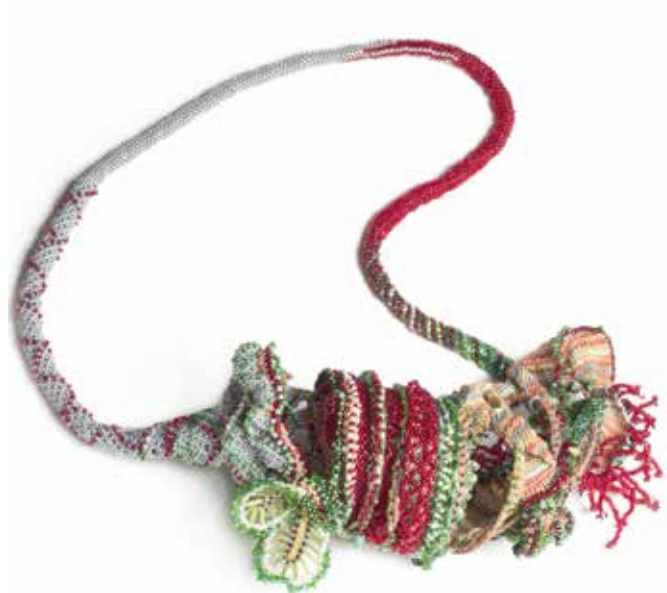
Bétonisation de la forêt Papier japonais, hématite, turquoise, fils plastiques, perles rocaïlle, nylon

«Quand je conçois et réalise une œuvre, je tente de mettre du sens dans chaque forme, chaque couleur, chaque texture. Chaque partie est significative dans ma propre mythologie.