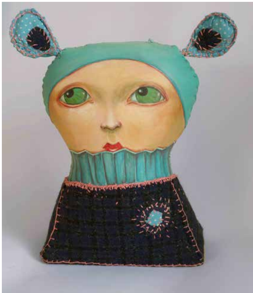
Glütznstoffe Broderie et peinture sur tissu

«Compagnons dans la vie, ils sont aussi voisins d'atelier. Quand l'un peint, l'autre coud.