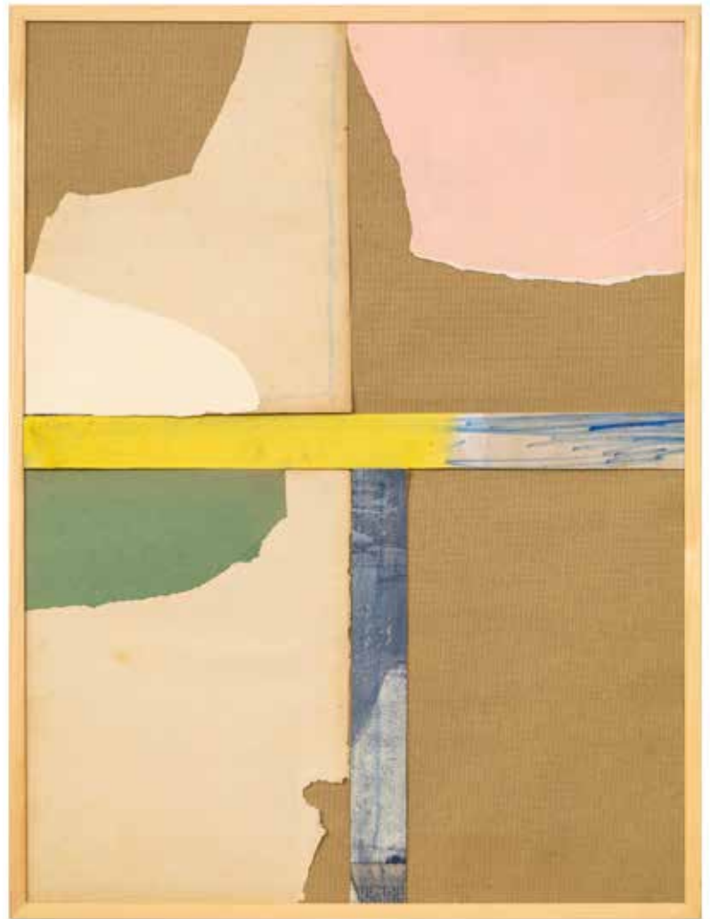
Sans titre (assemblage 1)

Technique mixte, toile, bois et papier avec cadre en bois clair