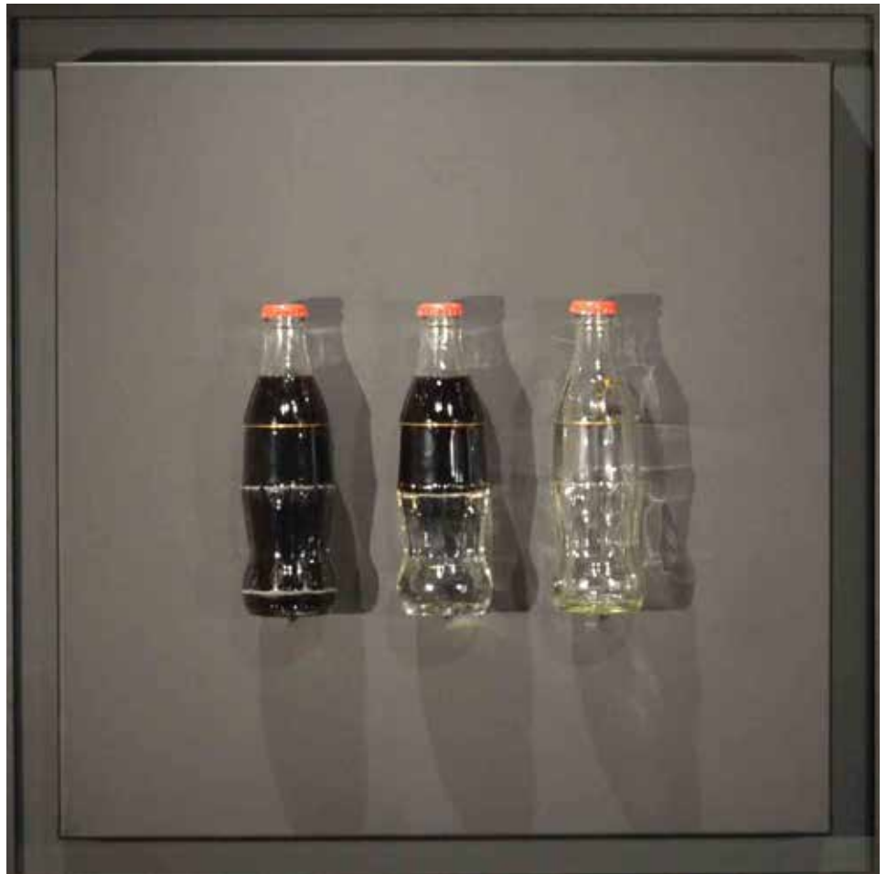
Rien ne va plus ou Tombé sur la tête Assemblage sur toile XL encadré, caisse américaine sur fond

Simultanément et en pendant à la peinture minimaliste et radicale sur toile noire, Jean-Pierre Balloué pratique la sculpture d'objet sur le même support. Les objets mis en scène et présentés par un titre (partie intégrante de son travail) sont porteurs de symboles ou d'images métaphoriques qui interpellent le spectateur dans son imaginaire ou ses fantasmes et l'amènent à un autre point de vue décalé, entre humour, gentillesse et sarcasme.