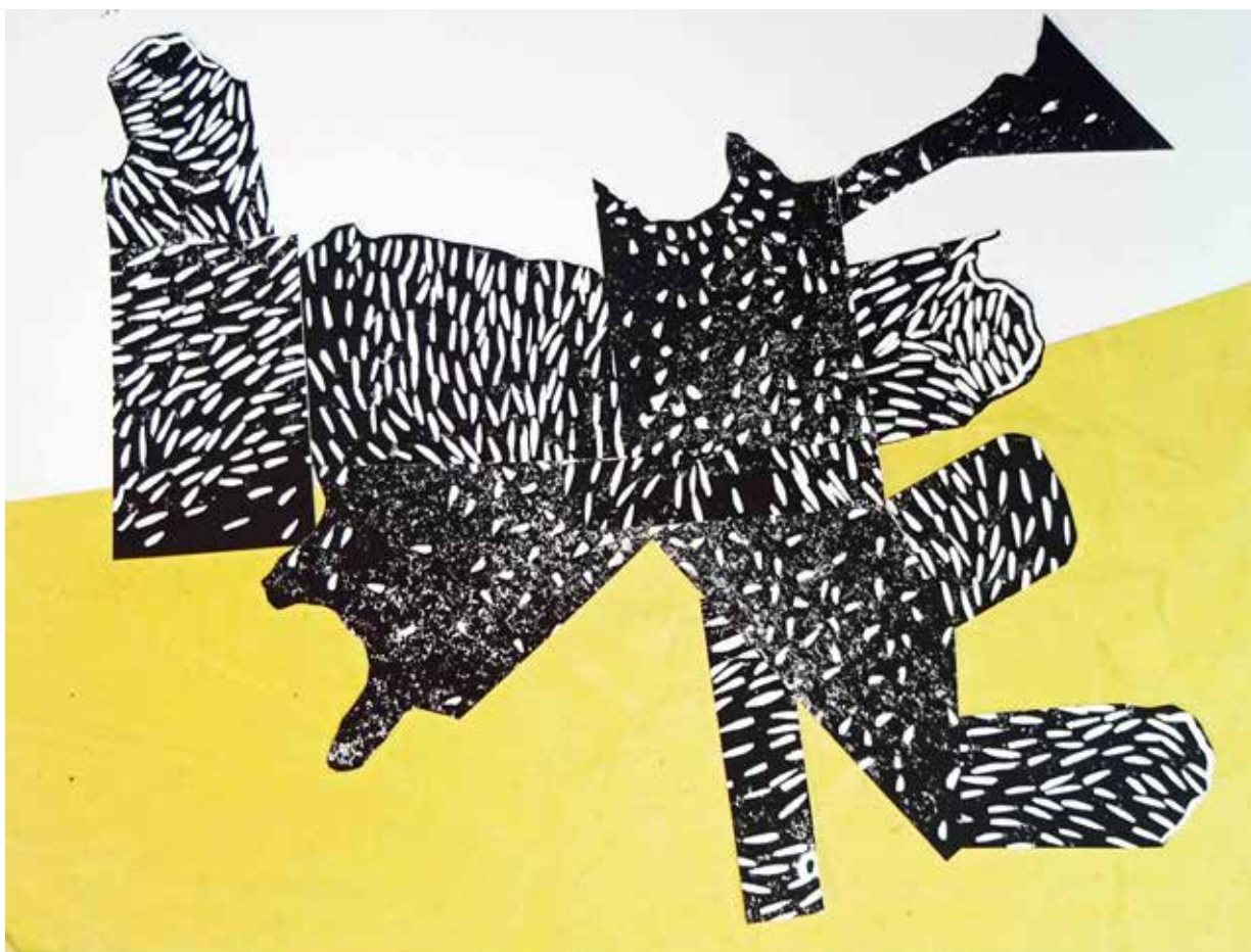
Série Sans Titre (détail) Papiers collés

«Avisant la corbeille des tirages ne me satisfaisant pas et qui me servent habituellement pour mes correspondances, j'ai troqué fusain et gouge contre les ciseaux et joué avec les formes, les pulvérisant par découpes plus ou moins aléatoires, recomposant matières, supports et gestes et crée de nouvelles images. Le résultat me paraît ludique, hétérogène jusque dans les supports. Le collage, et plus exactement ici le papier collé , m'apparaît comme une pratique transgressive, moi qui tends à la maîtrise du geste et au dépouillement dans le processus créatif. Il m'a semblé intéressant de mettre en regard ces collages avec un dessin, pour rendre visible la rupture avec mon travail courant, habituel. Mais la forme organique semble se développer de façon incontrôlable à partir d'un bloc sombre et, peut-être, d'une autre nature. Elle s'échappe.»