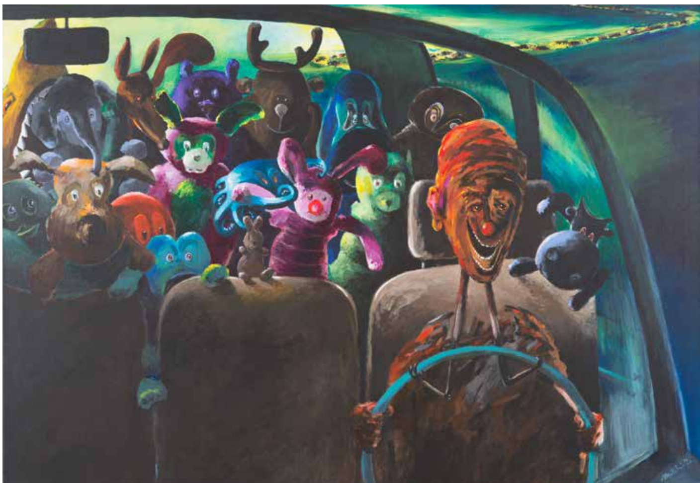
Le convoi Acrylique sur toile

«Fil rouge dénonciateur et témoin, ce lapin signale l'ébranlement d'une mascarade, faite toute de bigarrures, soulevant l'incongruité, convoquant l'insolite, créant le saugrenu et l'effroi. Epouvante d'un fou au volant qui aurait trop de dents... Rire ou frémir?... Et pour aller où?»