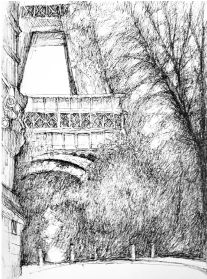
Sans titre Encre sur papier