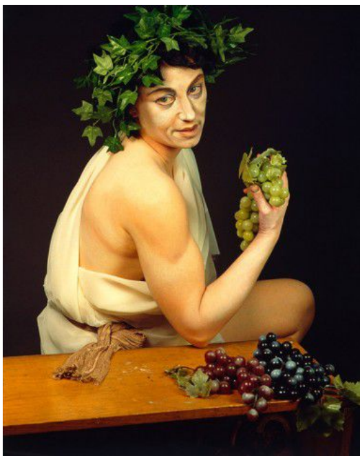
Cindy Sherman, Autoportrait en Bacchus malade , 1990, New York, MoMA.

L'autoportrait dit « voici comment je me suis vu à un moment donné », mais il dit aussi « voici comment j'ai voulu que l'on me voie ».