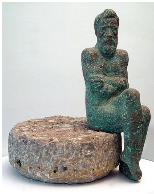
Constantin Brancusi, Autoportrait , 1990, Musée national Cotroceni, Bucarest.