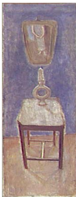
Szenes Arpad, Autoportrait , 1930, Paris, Centre Pompidou.