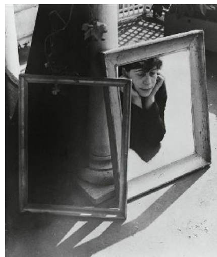
Florence Henri, Autoportrait aux cadres , 1938, Paris, Centre Pompidou.