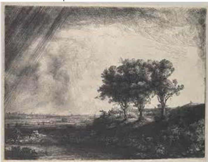
Œuvre de Rembrandt

La collection graphique de la Staatsgalerie Stuttgart présente pour la première fois depuis près de 100 ans une sélection des fonds remarquables de gravures noires d'artistes tels que Sir Joshua Reynolds, Benjamin West, Joseph Wright of Derby et autres. En entamant un dialogue avec des gravures de Rembrandt, en partie jamais montrées en public, cette exposition offre une découverte passionnante à ses visiteurs.