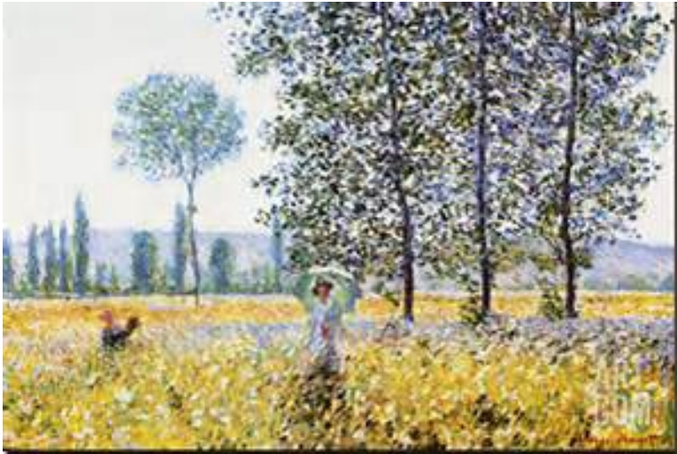
« Champs au printemps » de Monet

dessins de Vincent van Gogh et des tableaux de son ami Armand Guillaumin également rarement présentés au public marquent la fin du mouvement pictural.