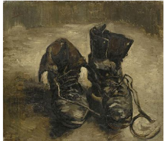
Vincent Van Gogh Les Roulottes ou campement de bohémiens aux environs d'Arles (1888) et Les souliers (1886), huile sur toile.

*La transhumance, du latin trans (de l'autre côté) et humus (la terre, le pays), est la migration périodique d'une part du bétail (bovidés, cervidés, équidés et ovins) de la plaine vers la montagne ou de la montagne vers la plaine, d'autre part des abeilles d'une région florale à une autre, et ce en fonction des conditions climatiques et donc de la saison. Déplacement saisonnier d'un troupeau en vue de rejoindre une zone où il pourra se nourrir, ou déplacement du même troupeau vers le lieu d'où il était parti.