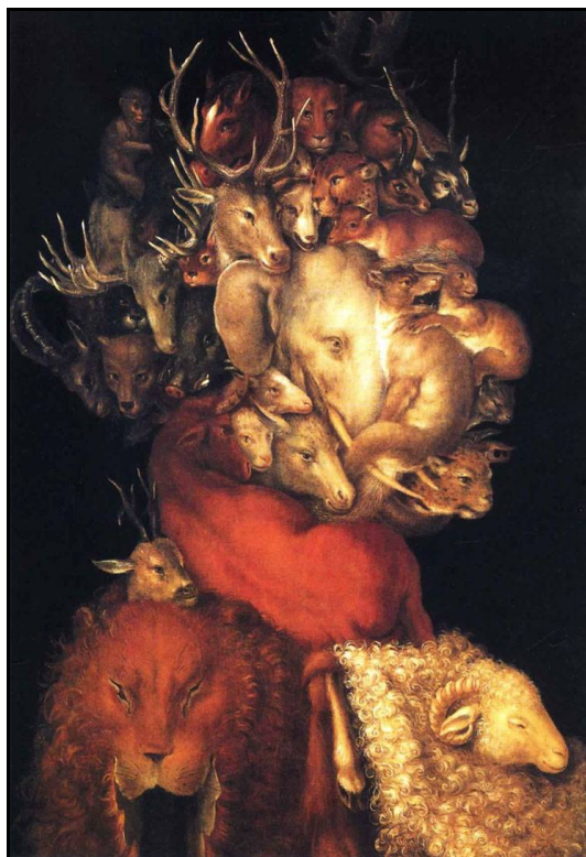
Couverture et image ci-dessus : Tête avec animaux sauvages ~1590 par Arcimboldo

Les critères de sélection sont l'originalité et la qualité.