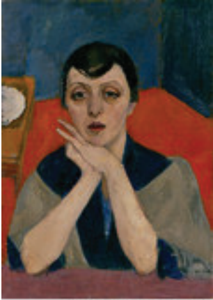
Museum für Neue Kunst - Städtisches Museum Freiburg Bildnisse I von Hans Macke, 1911, Öl auf Leinwand, 100 x 100 cm Leihgabe des MNSK, Baden-Württemberg, Foto: Klaus Peter Knorr

EXPOSITION TEMPORAIRE : 30+30 RETRO/PERSPEKTIV DIX, MACKE, OPPENHEIM & CIE 14/03/2015 - 07/06/2015